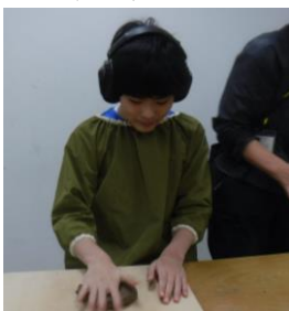
陶芸の様子（陶土を伸ばして成型します）

中学部では、週に1度「作業学習」を設定し、身だしなみや挨拶、報告等の働くための力の育成に取り組んでいます。