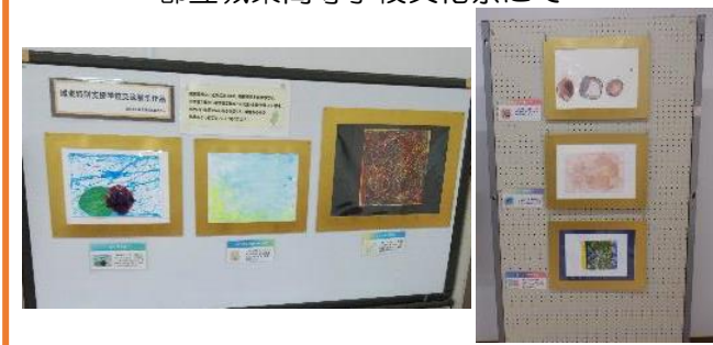
都立城東高等学校文化祭にて