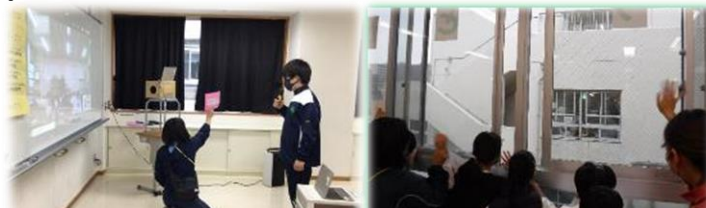
オンラインで自己紹介

その他の学年もそれぞれの学校で自己紹介の内容を決めたり、ダンスや手話歌等の練習をしたりと準備を進め、当日はオンラインなどで対面し、手を振り、お互い知り合い、学び合う良い機会となりました。子供たちからは「今度はオンラインじゃなくて会えるといいね」との声も聞かれました。