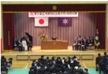
開校記念式典の様子（平成28年度）

11月22日（月）は本校5回目の開校記念日です。5年前の平成28年11月22日に開校記念式典が行われました。小学部の児童が学校の誕生を祝ってケーキの装飾を作ったり、中学部の生徒は作業学習で来校者向けの記念品を製作したりしました。10年目、さらに20年目に向けて、更に学校を発展させ、地域に根差した教育活動を充実させていけるよう教職員一同努めてまいります。