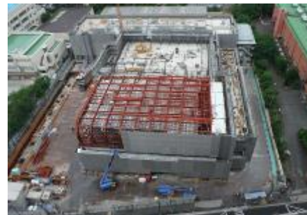
建設中の校舎（平成27年6月撮影）