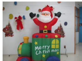
(大島文化観光協会様より)

開校から3年が経ち、地域近隣との連携も深まり「江東区大島の城東特別支援学校」としての存在意義もできつつあります。大島文化観光協会の方々との連携、社会貢献活動での大島高齢者在宅サービスセンターの利用者の方々との交流など、子供たちの地域への活動にも広がりも出て参りました。また、学校運営連絡協議会、防災教育推進委員をはじめ、学校間交流、避難訓練、宿泊防災訓練など様々な活動におきまして、町会や各学校、商店街の方々の御理解と御協力に支えられてきました。本校にとって大切なことは、開校以来積み上げてきた実績を基に、さらに本校の子供たちにこれからの自立と社会参加を目指した「必要な資質・能力」を育成するために、地域社会と連携を深め「社会に開かれた教育課程」を実現することです。本校も新しい学習指導要領に示された「社会に開かれた教育課程」を実現するために、教員間でその理念の共通理解を図り、今後の授業改善と組織体制の整備、来年度の計画に着手しています。児童・生徒たちが今以上に有意義な学校生活を送ることができるよう、全教職員が一丸となって努力して参ります。引き続き、御理解と御協力をお願いいたします。